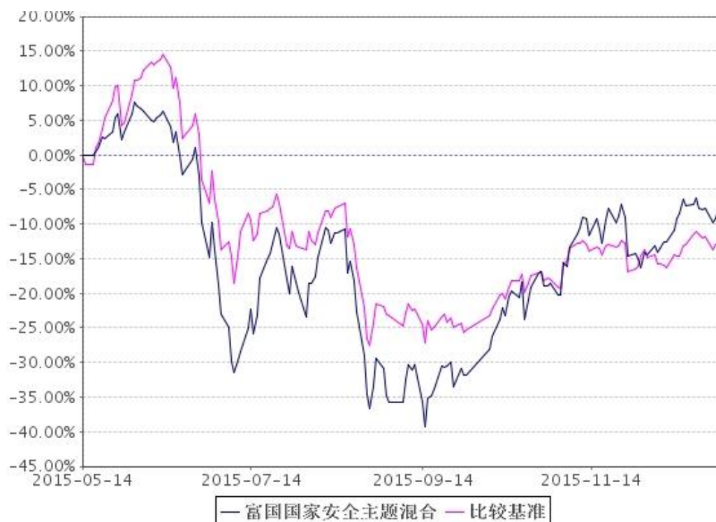
基准收益率变动的比较

注：1、截止日期为 2015 年 12 月 31 日。本基金合同生效日为 2015 年 5 月 14 日，截至报告期末本基金合同生效不满一年。